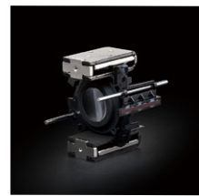
VXD (Voice-coil eXtreme-torque Drive)： リニアモーターフォーカス機構

AF駆動には、リニアモーターフォーカス機構VXD*3を搭載しました。高速かつ高精度に動作するとともに、優れたレスポンス性能を発揮。フォーカス追従性も高く、スポーツや乗り物、野生動物などの撮影に素早く対応可能です。さらに静粛性においても、フォーカス時に振動が発生しにくいいため、静けさが求められる環境下での静止画撮影や動画撮影にも最適です。