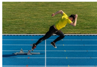
焦点距離：150mm 露出：F5.6 1/2000秒 ISO500