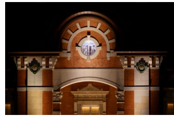
焦点距離：500mm 露出：F6.7 1/30秒 ISO3200

超望遠域での撮影では、微細な振動さえも像の不鮮明化につながります。そのため、本レンズでは手ブレ補正機構VC*1を搭載することでより安定した画づくりをサポート。三脚を使わない手持ち撮影においてもその力を発揮します。また、流し撮り専用モードを含む3つの補正モードを切り替えるスイッチを搭載し、撮影条件や好みに応じて最適な手ブレ補正モードを選択することができます。