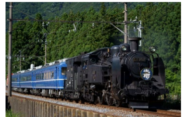
焦点距離：102mm 露出：F4.5 1/800秒 ISO100

AF駆動にはレンズ位置を高精度に検出するセンサーと、AF制御に最適化されたステッピングモーターユニットRXD (Rapid eXtra-silent stepping Drive)を搭載。高速かつ精緻なAFを実現し、被写体が動き続ける動体撮影や動画撮影でもその力を発揮します。静粛性にも優れており、動画撮影時もレンズ駆動音が気になりません。