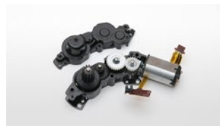
Model A037に搭載のOSDユニット

AF 駆動ユニットに静音性に優れたOSD(Optimized Silent Drive)を採用。オートフォーカスユニットを刷新・最適化したことで駆動音が減少したため、静粛性が求められるシーンでも存分に活躍します。また、AFの精度とスピードも向上しており、動きのある被写体にフォーカスする際も、シャッターチャンスを逃しません。