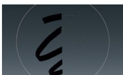
左:防汚コートなし 右:防汚コートあり

レンズ最前面に撥水性・撥油性にすぐれたフッ素化合物による防汚コートを採用。水滴、手の脂などが付いても拭き取りやすく、メンテナンスが容易です。また、屋外での使用を考慮し、レンズ鏡筒の可動部、接合部の各所に防滴用のシーリングを配する簡易防滴構造を採用しています。